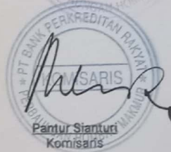
Pantur Sianturi Komisaris